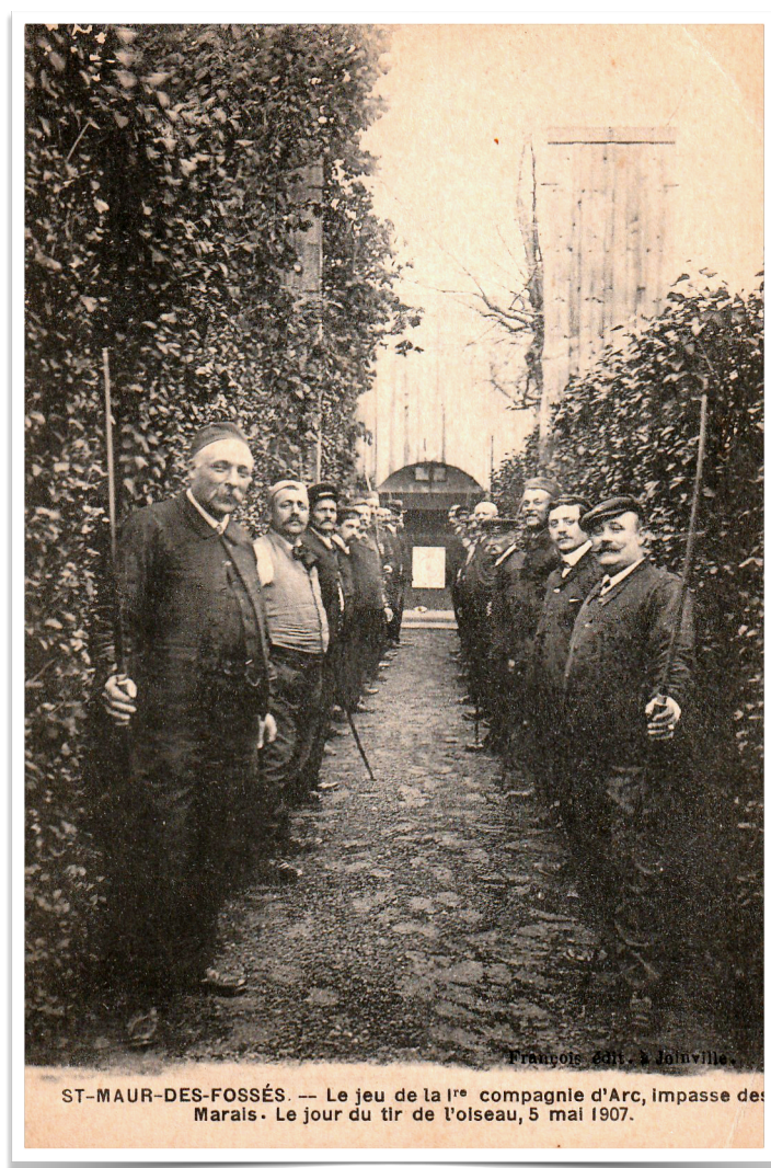
ST-MAUR-DES-FOSSÉS. — Le jeu de la 1 re compagnie d'Arc, Impasse des Marais. Le jour du tir de l'oiseau, 5 mai 1907.