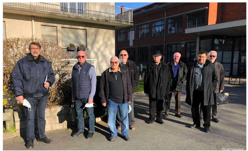
Bas les masques, l'instant d'une photo.