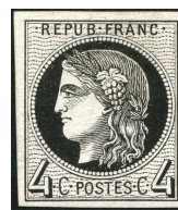
Épreuve du Report II

Pour mettre en évidence ces différences constitutives entre les deux reports, il faut agrandir les deux images.