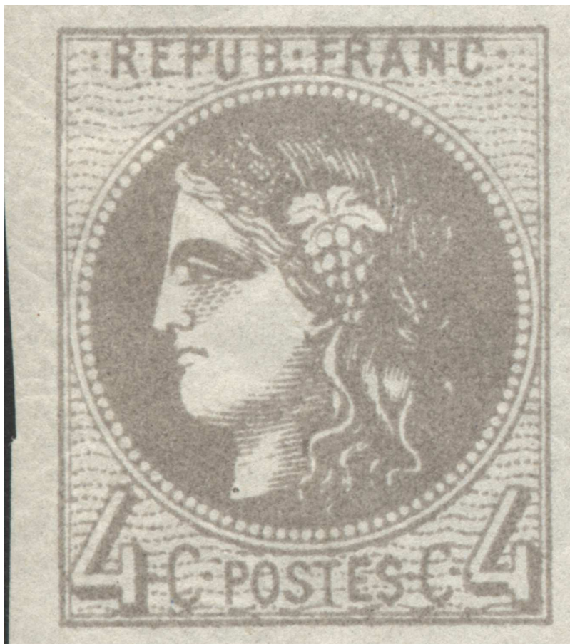
Timbre provenant du report II