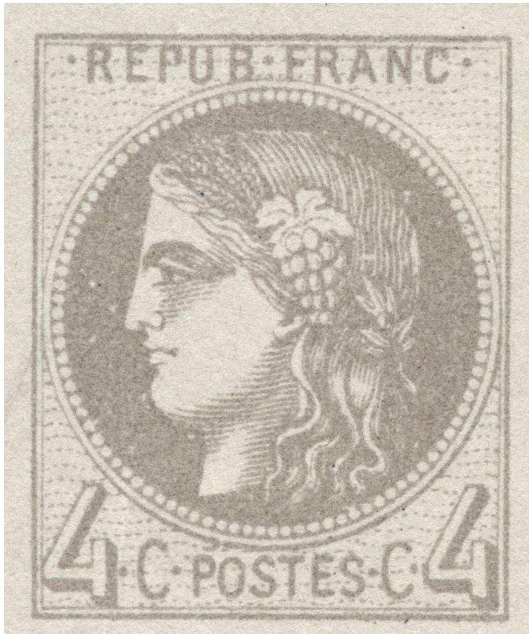
Agrandi 5 fois