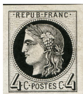
Épreuve du Report I

Pour distinguer les deux reports, le plus simple est d'examiner les tirages en noir, souvent dénommés « épreuve », qui ont servi à effectuer le transfert de la pierre matrice à la pierre d'impression et en déterminer les caractéristiques propres à chaque report.